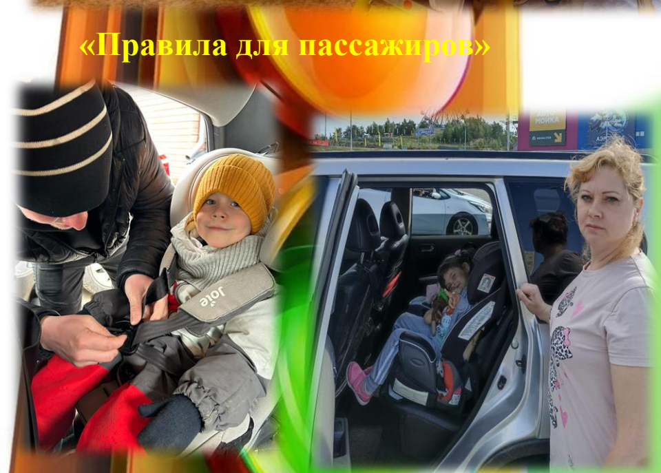
«Правила для пассажиров»