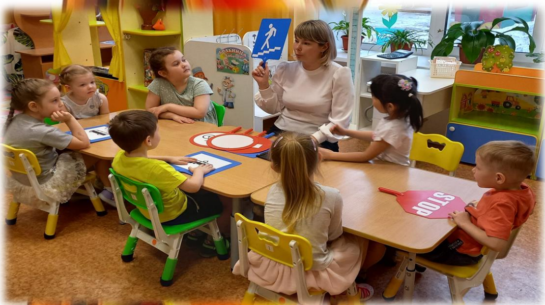
Тематические беседы: «Знаки дорожные помни всегда»